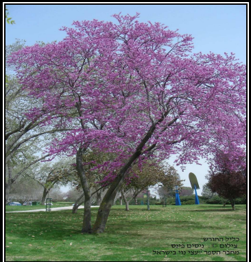
כליל החורש צילום © יוסים פינס מחבר הספר "עצי נוי בישראל"

עץ בגובה בינוני (בין 3 ל-10 מ'), בעל צמרת מעוגלת בקוטר בינוני (5-7 מ'). עץ נשיר, בעל פריחה ורודה-ארגמנית מרשימה במרץ עד מאי. הפרחים מכילים כמות רבה של צוף, ומושכים אליהם דבורים וציפורים. עלי הכותרת של הפרחים אכילים. עמיד לתנאי קרקע קשים, לגיר וליובש. רגיש לקרקעות מלוחות. דורש תנאי הארה של שמש עד חצי-צל. נפוץ בגננות, כעץ נוי. משמש כעץ צל, עץ פורח, וניתן לנטיעה בחצרות, בשדרות, בחורשות, כבודד או בקבוצה.