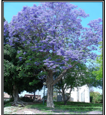
סיגלון חד-עלים צילום © יוסים פינס מחבר הספר "עצי נוי בישראל"

עץ נשיר, גבוה (מגיע עד לגובה של 12-15 מטרים), בעל צמרת רחבה ומעוגלת (עד 8-12 מטרים). גדל בקצב מהיר יחסית, ובאביב פורח בפריחה סגולה-בהירה מרשימה. בהמשך הקיץ, ועד לסתיו, הסיגלון ממשיך לפרוח פריחות בודדות. זקוק לעיצוב הנוף בצעירותו (על ידי גנן מקצועי), ומומלץ מאוד לנטוע אותו בחצר גדולה. עמיד לקרה ולשרב, וכן למחלות ולמזיקים. ייחודו בדרישותיו המועטות ובפריחתו.