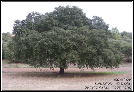
אלון תבור צילום © יוסים פינס מחבר הספר "עצי נוי בישראל"

עץ גבוה (מגיע עד ל-15 מ') בעל גזע רחב (בהיקף כ-3 מ') ונוף עגול (בקוטר 8-10 מ'). עץ נשיר, בעל עלים קשים ומשוננים ובלוטים. פורח פריחה אדמדמה בחודשים מרץ ואפריל. בעל קצב צמיחה בינוני. עמיד לתנאי קרקע קשים ולמגוון קרקעות. דורש חצר גדולה ושמש. רגיש לקרה וקור. משמש על פי רוב לנטיעה בחורשות ובפארקים, כעץ צל.