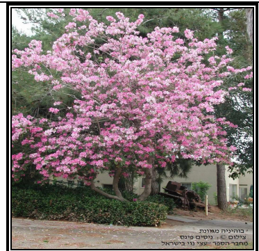
בוהיניה מגוונת צילום © יוסים פינס מחבר הספר "עצי נוי בישראל"

עץ המגיע לגובה בינוני (8-10 מטרים), בעל קוטר צמרת בינוני (8-7 מטרים) וצורת צמרת מעוגלת. עץ נשיר מותנה, הפורח באביב בפריחה ורודה או לבנה מרהיבה ושופעת. בעל קצב צימוח בינוני ורגישות בינונית לקור. דורש שמש מלאה (עד צל חלקי), והשקיה סדירה. מתאים לשימוש כעץ רחוב, שדרה או חצר, ומספק צל.